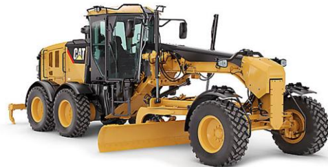
MOTONIVELADORA 17 t CAT 140K