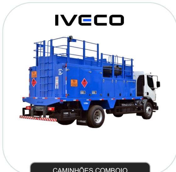
CAMINHÕES COMBOIO ABASTECIMENTO