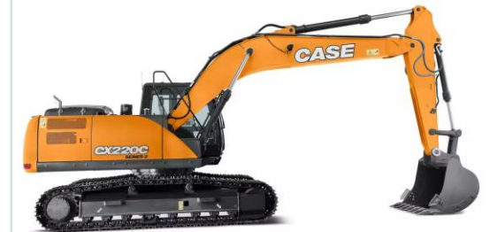
ESCAVADEIRA HIDRAÚLICA 21 t CASE CX220C