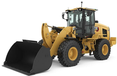
PÁ CARREGADEIRA 15 t CAT 938K