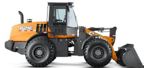
PÁ CARREGADEIRA 12 t CASE 621E