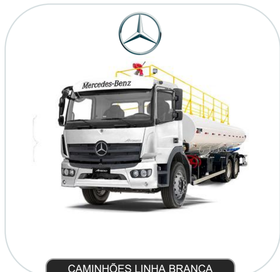
CAMINHÕES LINHA BRANCA PIPA